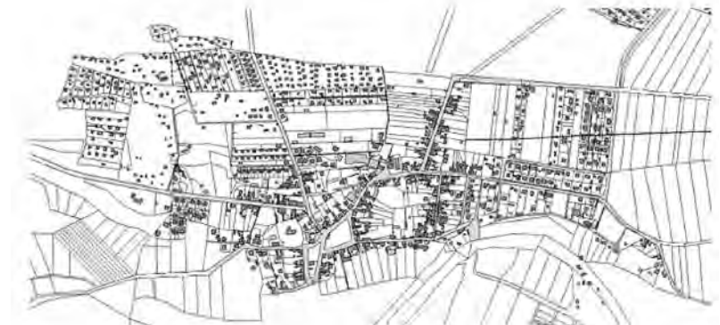
Abrechnungseinheit gemäß § 5 (2) (SABS - W - Pretzien)

zur Satzung über die Erhebung wiederkehrender Beiträge für die öffentlichen Verkehrsanlagen der Stadt Schönebeck (Elbe), Ortschaft Pretzien (SABS - W - Pretzien)