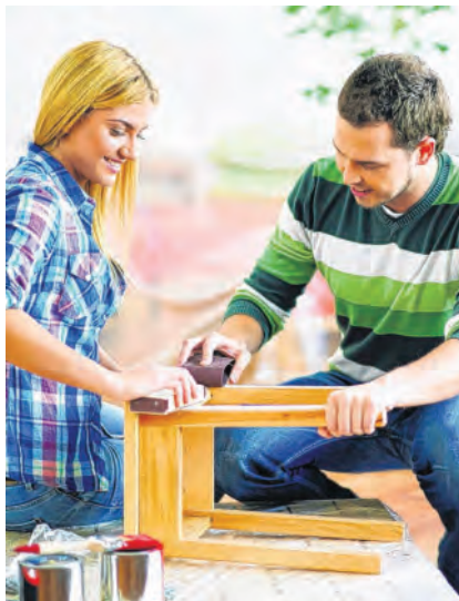
Mit ein wenig Gespür für Farben und etwas handwerklichem Geschick können sich auch Laien an die Lackierung von Möbeln wagen.

stoffen. Um sie zu lackieren, muss zuerst der saubere und fettfreie Untergrund mit einem Schleifpapier relativ feiner Körnung (120) leicht angeschliffen werden. Nach dem sorgfältigen Entfernen des Staubs kann mit dem Auftrag begonnen werden. Für den Laien sind 2in1-Produkte, in denen die Grundierung bereits enthalten ist, sicher am einfachsten zu verarbeiten. Bei Acryllacken auf Wasserbasis sollten Pinsel mit Kunststoffborsten eingesetzt werden. Für die Verarbeitung von Kunstharzlacken sind Naturborsten besser geeignet. Beim Lackieren sollte konsequent von einer Seite aus gearbeitet werden. Wenn nicht zu viel Lackmaterial aufgetragen wird, entstehen auch keine unschönen Nasen und Läufer.