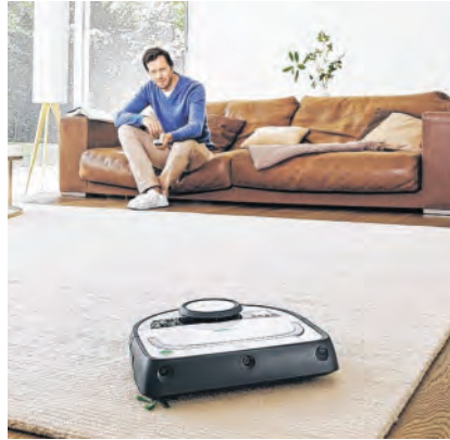
Der Saugroboter Kobold soll laut seinem Hersteller Vorkerk über bis zu zwei Zentimeter hohe Barrieren klettern können. Was zu hoch ist, umfahre er einfach.