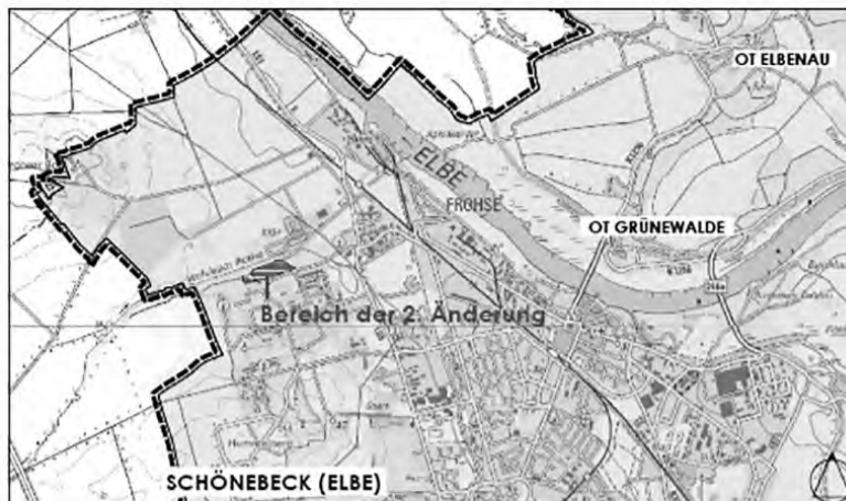
Top. Karte 1:50.000 Sachsen-Anhalt, ohne Maßstab

Die Lage des Geltungsbereiches der 2. Änderung des Flächennutzungsplanes Schönebeck (Elbe) 2020 ist auf den nachfolgenden Abbildungen ersichtlich.