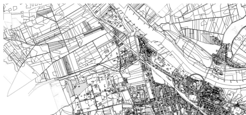
Lage im Stadtgebiet, Liegenschafts-Informationssystem der Stadt Schönebeck (Elbe)

Das Plangebiet (Änderungsbereich) ist auf den nachfolgenden Übersichtsplänen dargestellt.