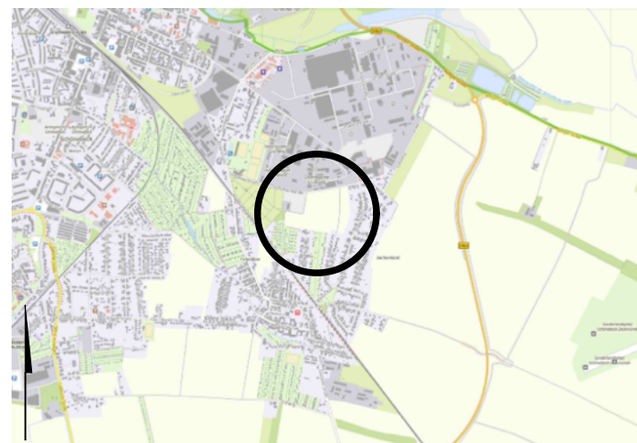
Übersichtskarte zum Flächennutzungsplan der Stadt Schönebeck (Elbe) 5. Änderung Maßstab 1:50.000