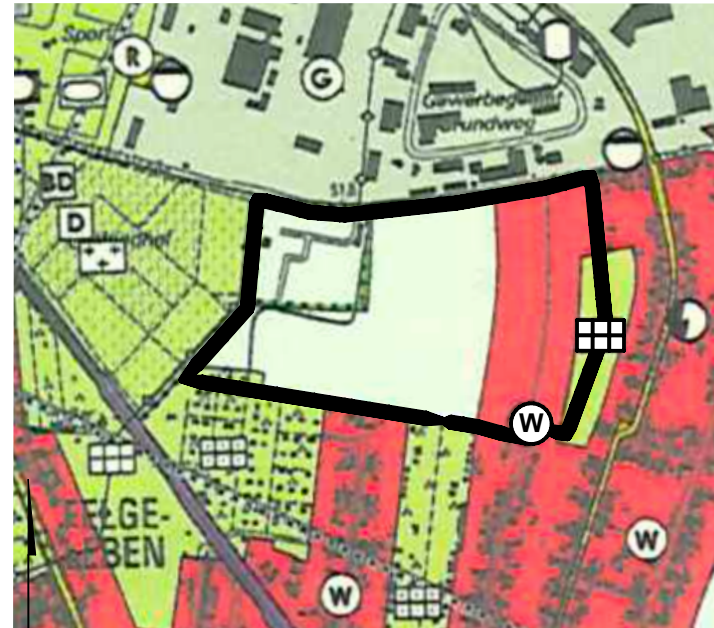
Flächennutzungsplan (Ausschnitt) in der Fassung 2017 Maßstab 1:10.000

Kommunalverfassungsgesetz des Landes Sachsen-Anhalt (KVG LSA) vom 17. Juni 2014 (GVBl. LSA S. 288) zuletzt geändert durch Artikel 1 des Gesetzes vom 17. Dezember 2025 (GVBl. LSA S. 834) Baugesetzbuch (BauGB) in der Fassung der Bekanntmachung vom 3. November 2017 (BGBl. I S. 3634), das zuletzt durch Artikel 5 des Gesetzes vom 22. Dezember 2025 (BGBl. 2025 I Nr. 348) geändert worden ist Baunutzungsverordnung (BauNVO) in der Fassung der Bekanntmachung vom 21. November 2017 (BGBl. I S. 3786), die zuletzt durch Artikel 2 des Gesetzes vom 3. Juli 2023 (BGBl. 2023 I Nr. 176) geändert worden ist Planzeichenverordnung (PlanZV) vom 18. Dezember 1990 (BGBl. 1991 I S. 58), die zuletzt durch Artikel 6 des Gesetzes vom 12. August 2025 (BGBl. 2025 I Nr. 189) geändert worden ist